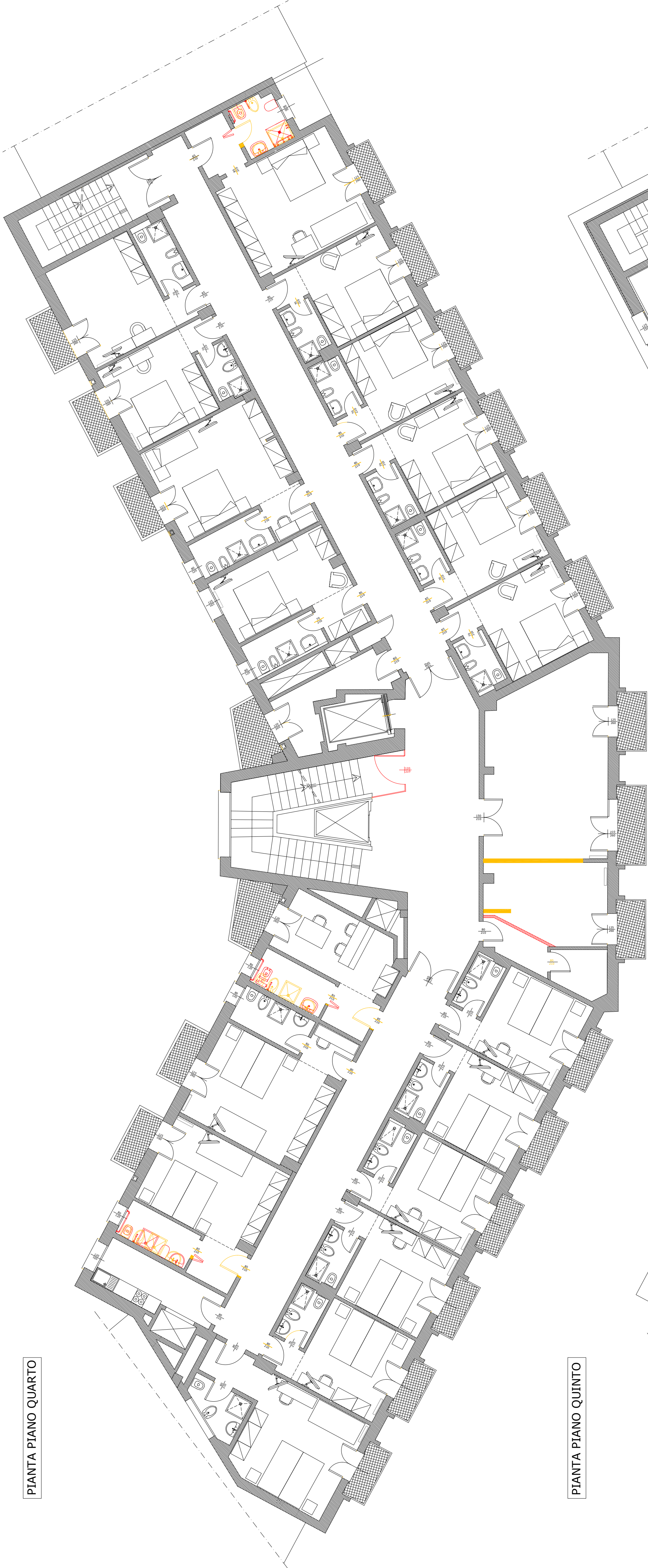
PIANTA PIANO QUINTO