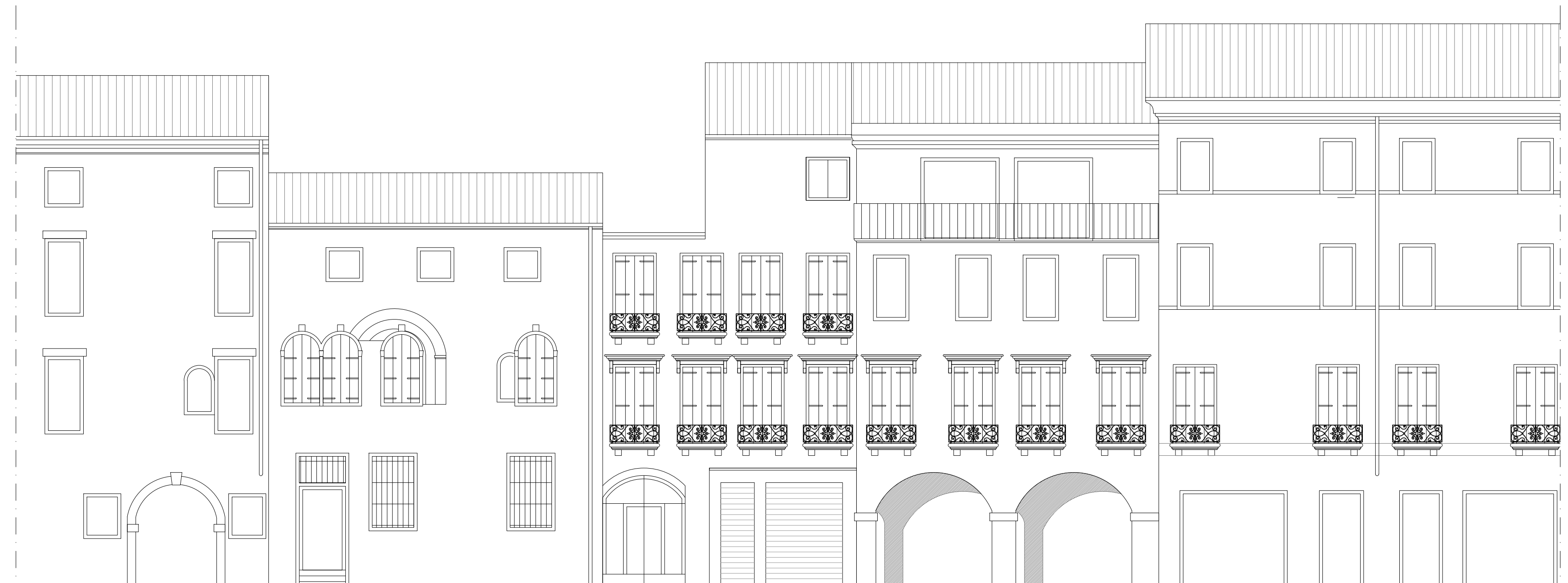
PROSPETTO NORD - VIA MANIN