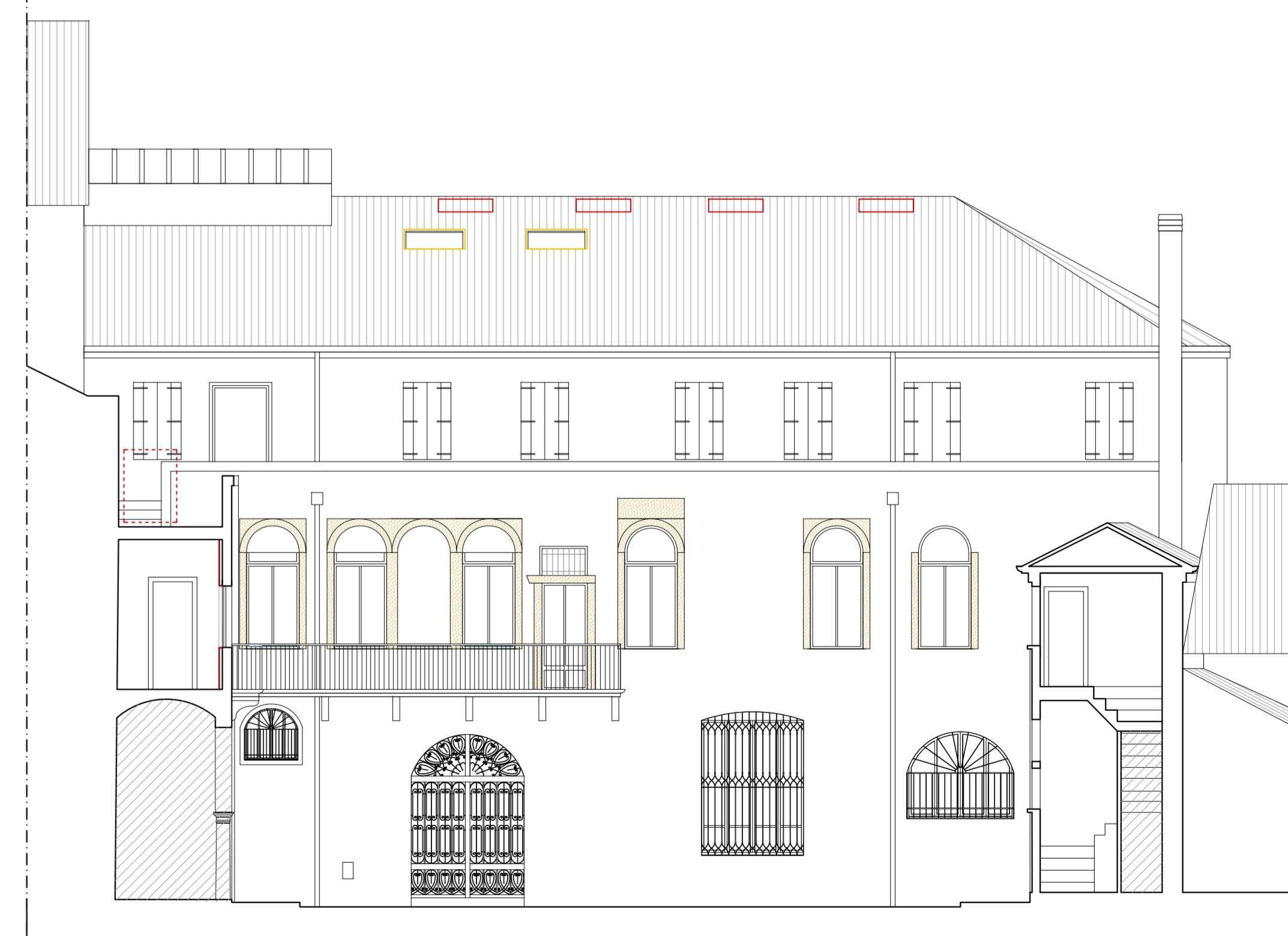
PROSPETTO INTERNO CORTE