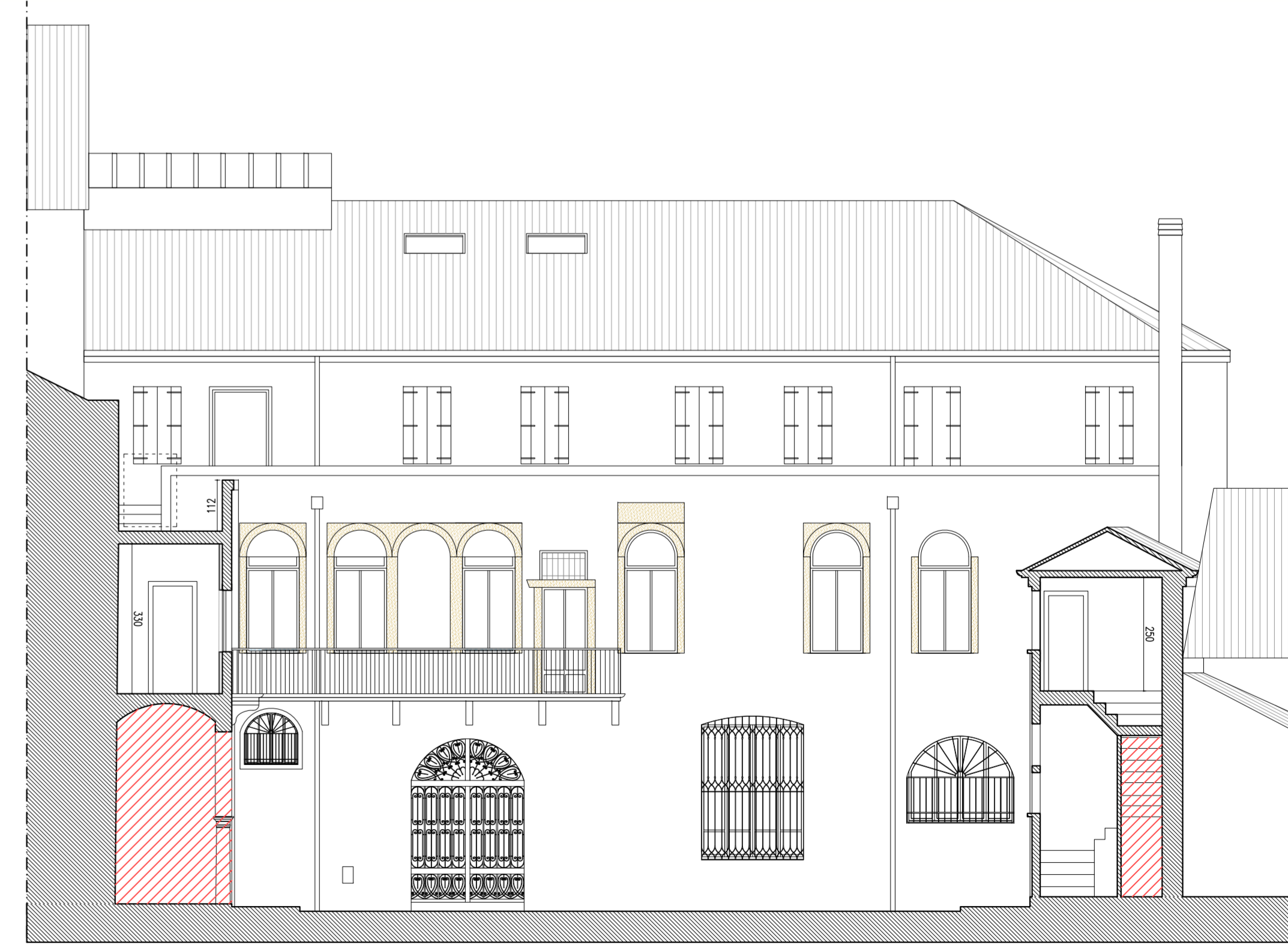
PROSPETTO INTERNO CORTE