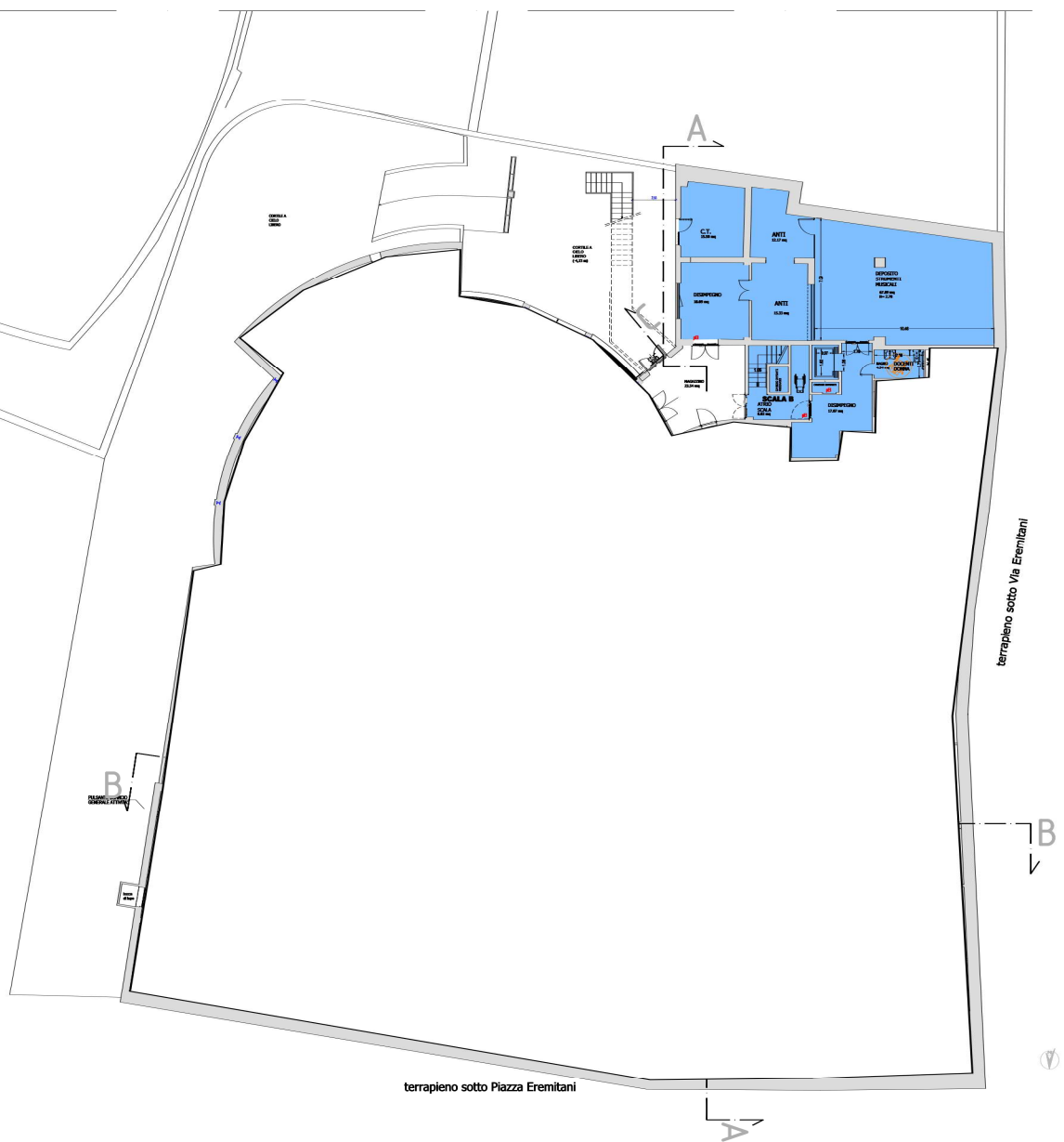
PIANTA PIANO INTERRATO