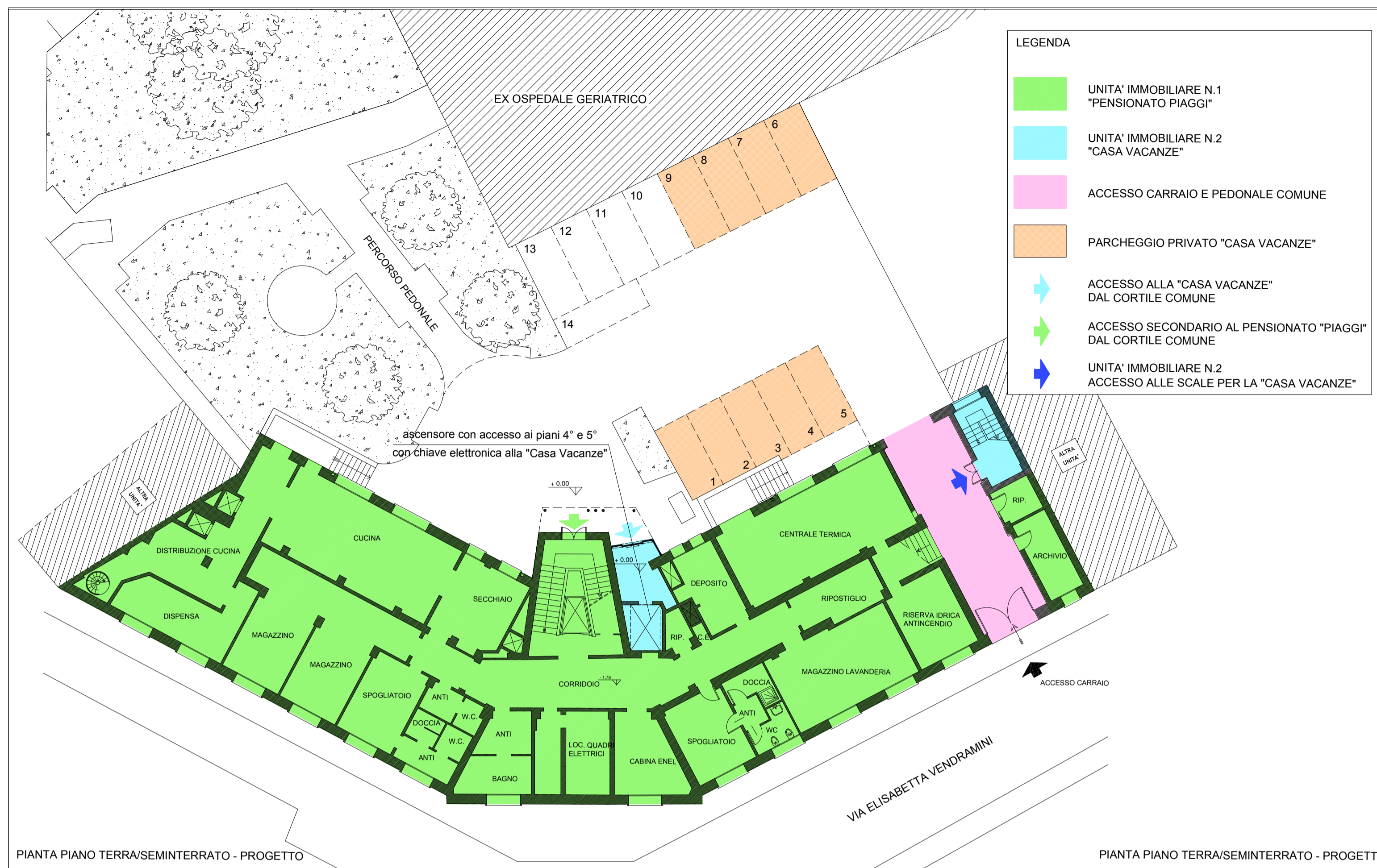
PIANTA PIANO TERRA/SEMINTERRATO - PROGETTO